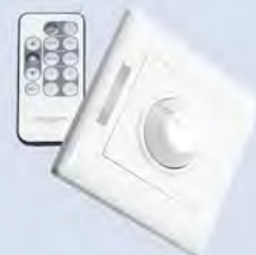
REG - A3600 VARIATEUR 1-10V