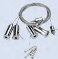
PAC - A5 KIT DE SUSPENSION